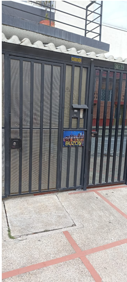
70455 CERRADO... EDIFICIO HABITAT 96 AP 506.