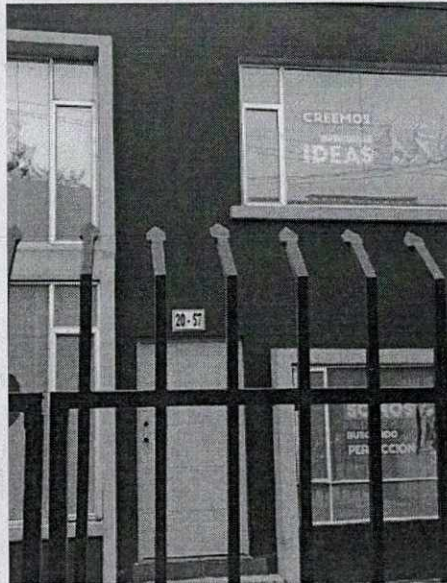
Grupo avalar, 2-2022-75480, no atienden