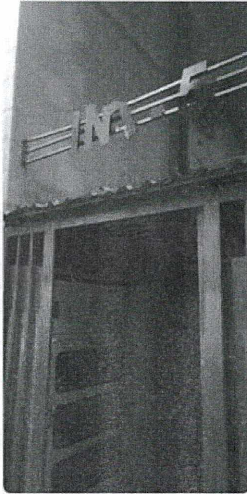
66949 CERRADO nadie atiende BOLONIA APTO 601 INT 5 BLQ J