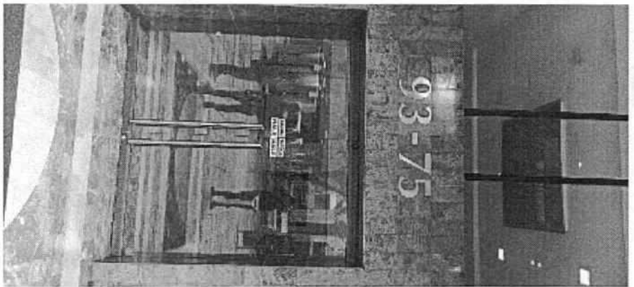
2-2022-62603 NO RESIDE... Hace más de 1 año, informan en la recepción. BR PROYECTOS.