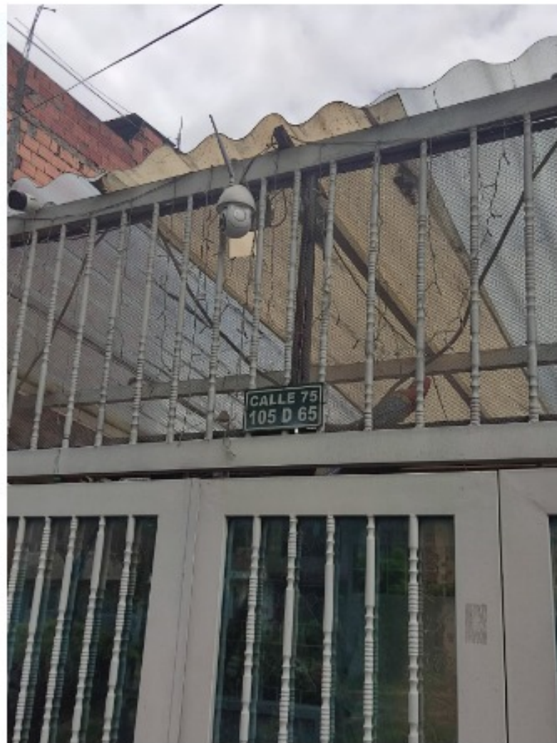
Banking brokers group, 2-2022-44625, no atienden