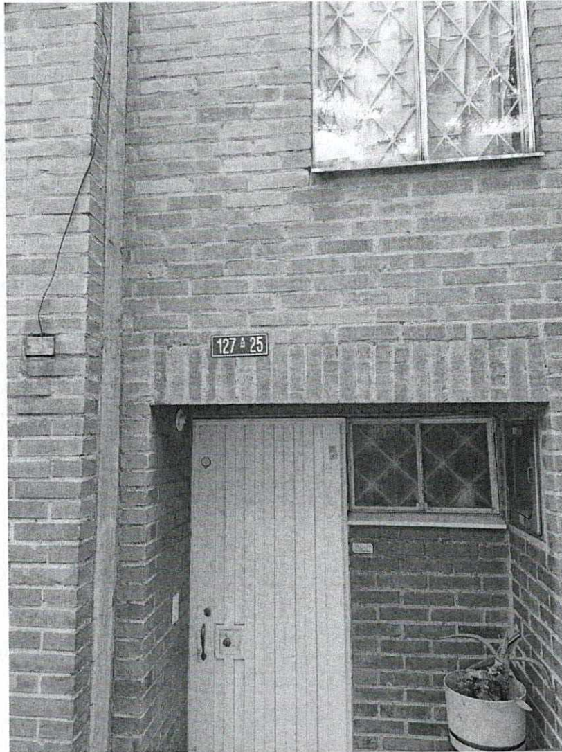
Portal inmobiliario, 2-2021-41152, no atienden, no responden