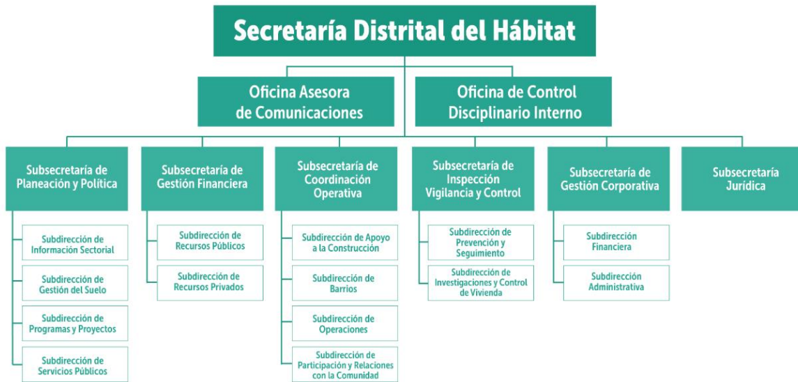
Figura 1. Estructura Organizacional SECRETARÍA DE HABITAT