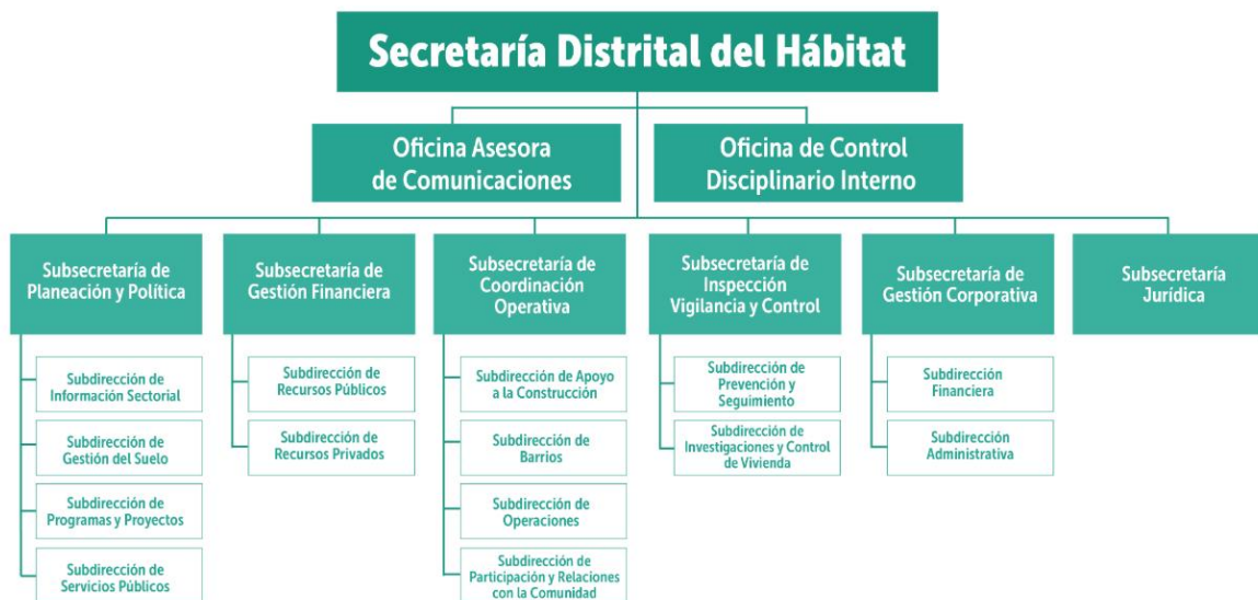
Figura 1. Estructura Organizacional SECRETARÍA DE HABITAT

A continuación, se presenta el organigrama de la Secretaría Distrital del Hábitat, el cual describe cómo se estructuran las funciones, responsabilidades y niveles jerárquicos de la entidad