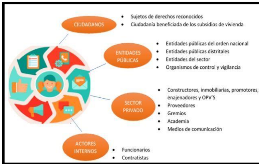
Ilustración 1: Esquema de usuarios