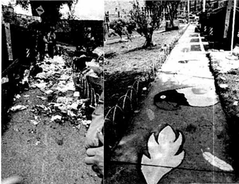
Antes y después de la intervención punto crítico Localidad de Usme – La Marichuela