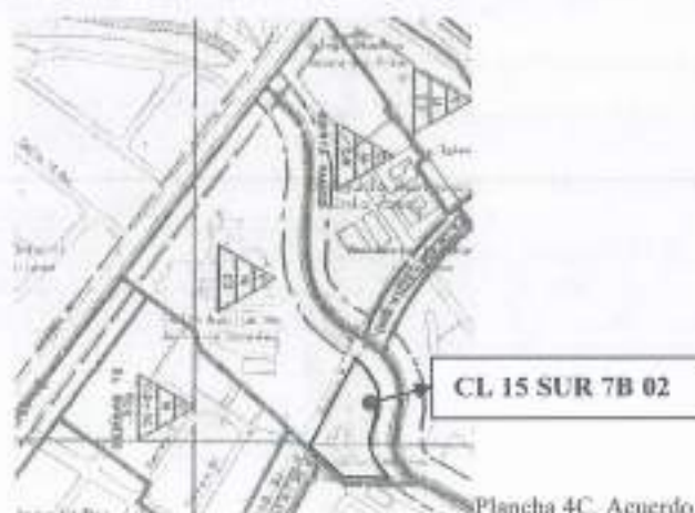
Plancha 4C. Acuerdo 6 de 1990

Lo anterior se señala debido a que en la Plancha 4C Plano oficial de zonificación y tratamientos, Acuerdo 6 de 1990, se encontró lo siguiente: