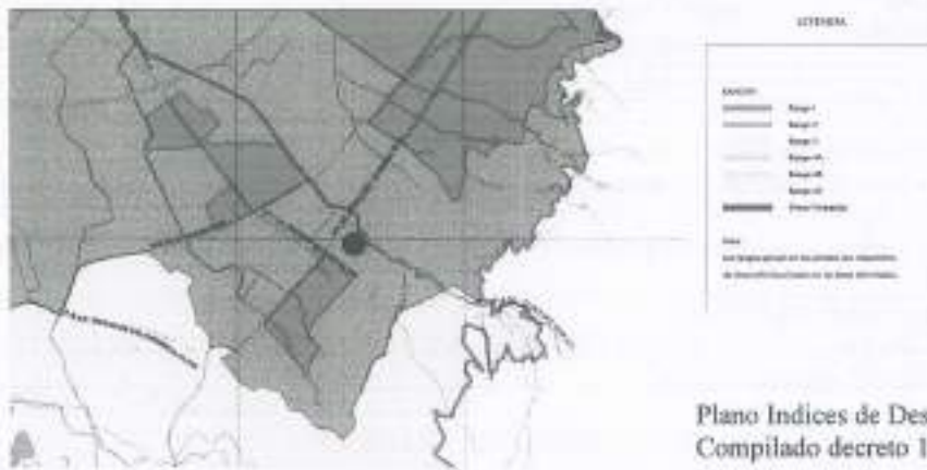
Plano Índices de Desarrollo. Compilado decreto 190 de 2004.

De acuerdo al análisis anterior, el predio efectivamente se encuentra señalado como Rango 2 en el Plano 18: Índices de Desarrollo, que corresponde a las áreas de la ciudad consolidada.