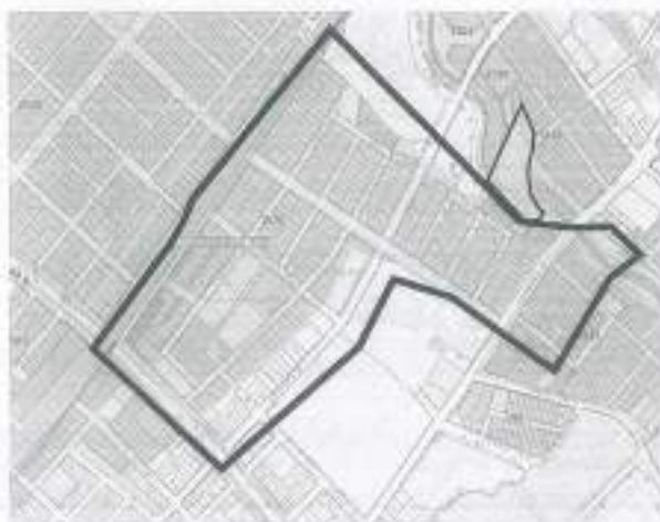
Sigdep Dadep. Urbanización colindante con el predio

Es pertinente aclarar que el "parque" al que se hace referencia se encuentra dentro del predio objeto de estudio el cual no se encuentra incluido en ningún área que haya sido urbanizada o haya sido objeto de legalización previamente, como se observa en la siguiente ilustración: