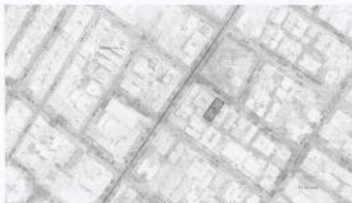
Calle 80 No. 10-43 Localización SINUPOT