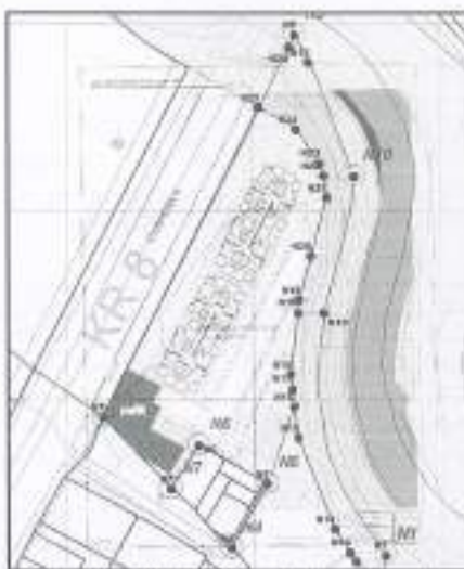
Fuente: Mapa de Referencia de Bogotá versión 06.20 (IDECA), Cuadro de coordenadas y mojones incorporación plano topográfico CL 15 SUR 7B 02 (UAECD), plano urbanismo CU1SC47/4-01 (Curaduría I y SDP), localización planta expediente 18-1-2758.

Con este proceso se pudo verificar que la planta arquitectónica invade la zona de manejo de preservación ambiental, en los parqueaderos 23, 24, 25, 26 y 39, sin embargo, es necesario contar con los archivos digitales correspondientes para confirmar esta situación.