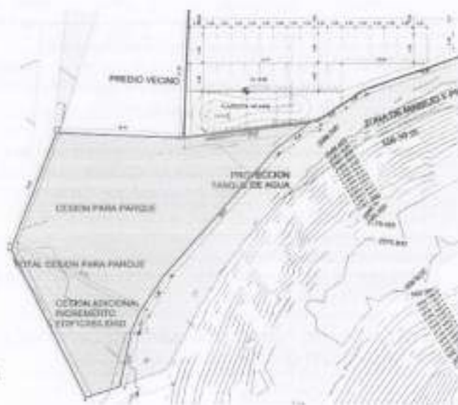
Plano Urbanístico Proyecto Kairos. CU1-SC47_4-00

Por lo anterior, se considera que, de acuerdo a lo aprobado en la licencia de construcción, hace parte del predio privado y que posteriormente sería cedida al distrito para que sea destinada como un área de uso público con un uso de zona verde. Sin embargo, es pertinente señalar que, aunque dicha cesión responde a la correcta aplicabilidad de las normas que rigen el tratamiento de desarrollo, no es aplicable para el predio en estudio dado que el tratamiento del mismo corresponde al Tratamiento de Consolidación para Sectores Urbanos Especiales, como se analizó previamente, al cual se le debió aplicar la normativa estipulada en el correspondiente Plan Maestro para Equipamientos.