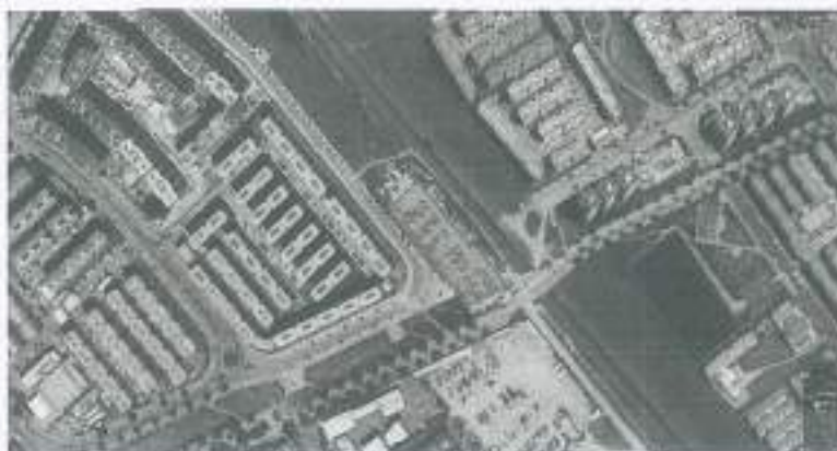
Imagen de localización del predio ubicado en la Calle 5A 93D-02.