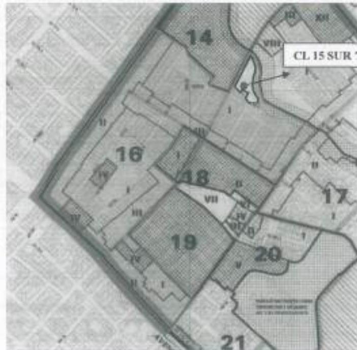
Localización del predio CL 15 S 7B-02 en el Sector Normativo 16.

De acuerdo a lo establecido en el Decreto Distrital 382 de 2004, el predio se encuentra en el sector normativo 16, el cual se reglamenta bajo la Actividad RESIDENCIAL, como una zona RESIDENCIAL CON ZONAS DELIMITADAS DE COMERCIO Y SERVICIOS, y se reglamentó como un tratamiento de CONSOLIDACIÓN CON DENSIFICACIÓN MODERADA. Para el sector normativo, el decreto hace las siguientes observaciones: