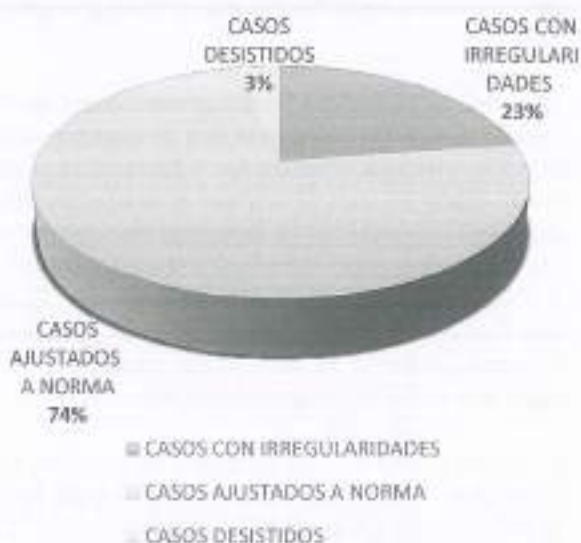
Estadísticas de los casos estudiados