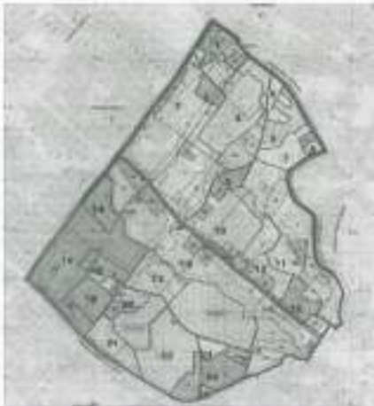
Delimitación de la UPZ N° 33 Sosiego. Plancha de Usos permitidos.

de las mismas las normas urbanísticas que definen un manejo diferenciado del territorio para los distintos sectores del suelo urbano y de expansión urbana. Son tratamientos urbanísticos el de desarrollo, renovación urbana, consolidación, conservación y mejoramiento integral (...) Por lo anterior, al remitirse al Decreto Distrital 382 de 2004 "Por el cual se reglamenta la Unidad de Planeamiento Zonal (UPZ) No. 33, SOSIEGO, ubicada en la localidad de San Cristóbal, se encontró lo siguiente: