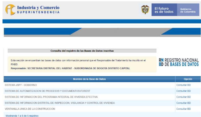
Imagen 7 Registro de 5 bases de datos en el Registro Nacional de Bases de Datos (RNBD)